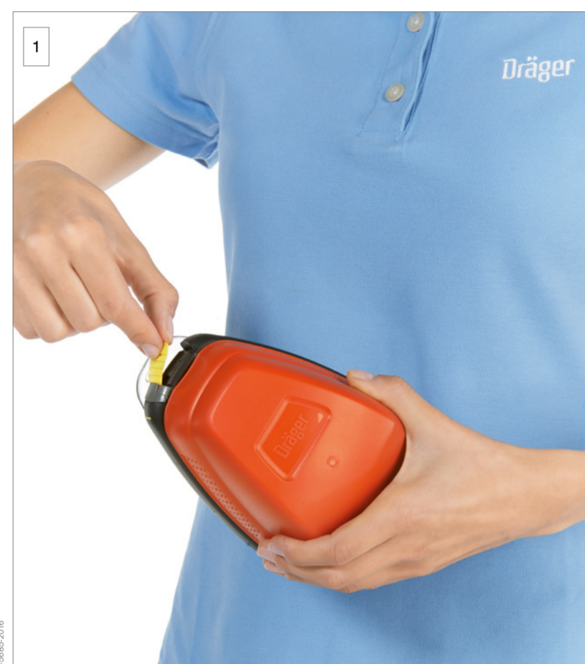
1 Chwyć i pociągnij plombę.