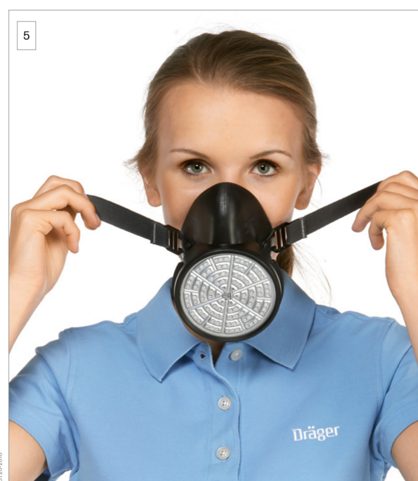
5 Przytrzymaj maskę za taśmy i załóż nią nos oraz usta. Umieść brodę w przeznaczony na to części.