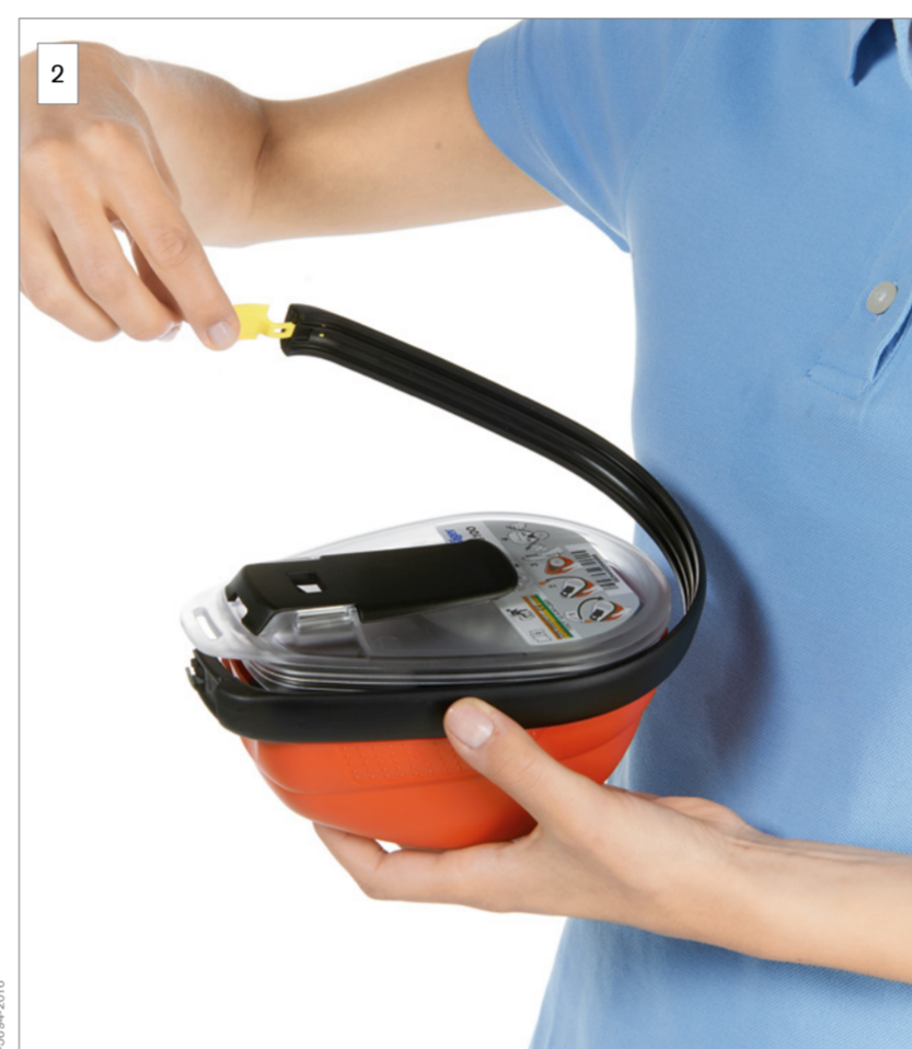
2 Zdejmij taśmę zabezpieczającą.