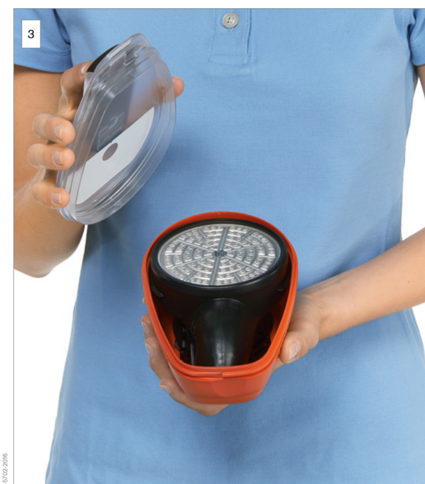
3 Otwórz opakowanie.