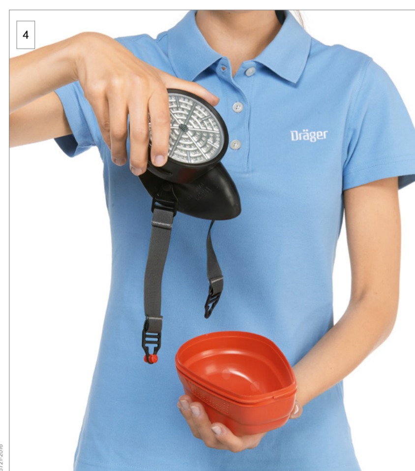
4 Wymij urządzenie.